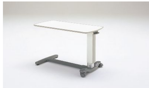
④ベッドサイドテーブル